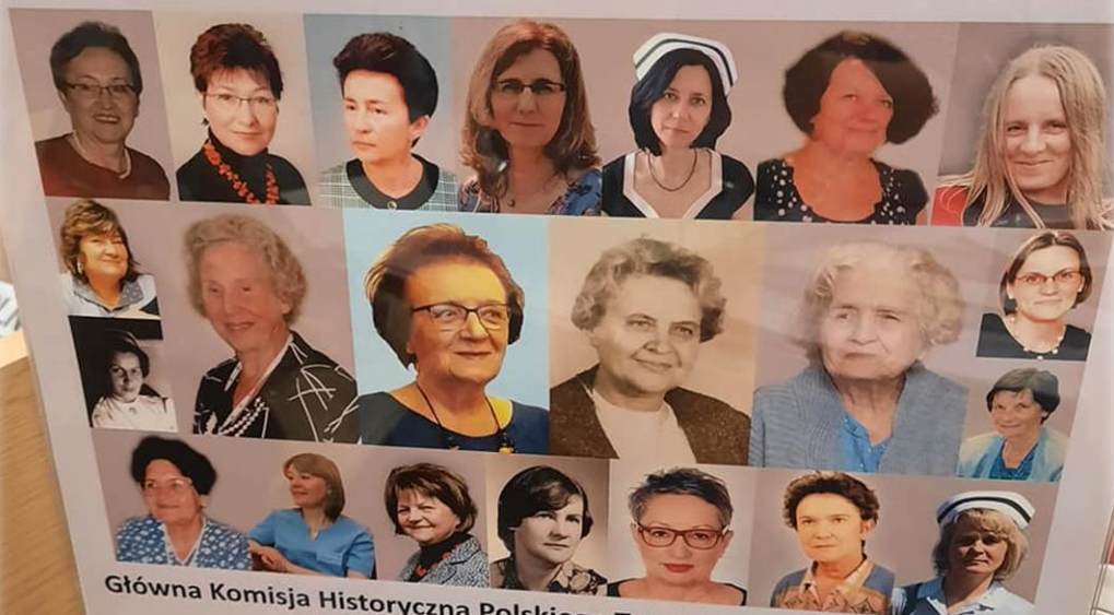
Główna Komisja Historyczna Polskiego Towarzystwa Pielęgniarskiego działająca od dnia 21 listopada 1961r.