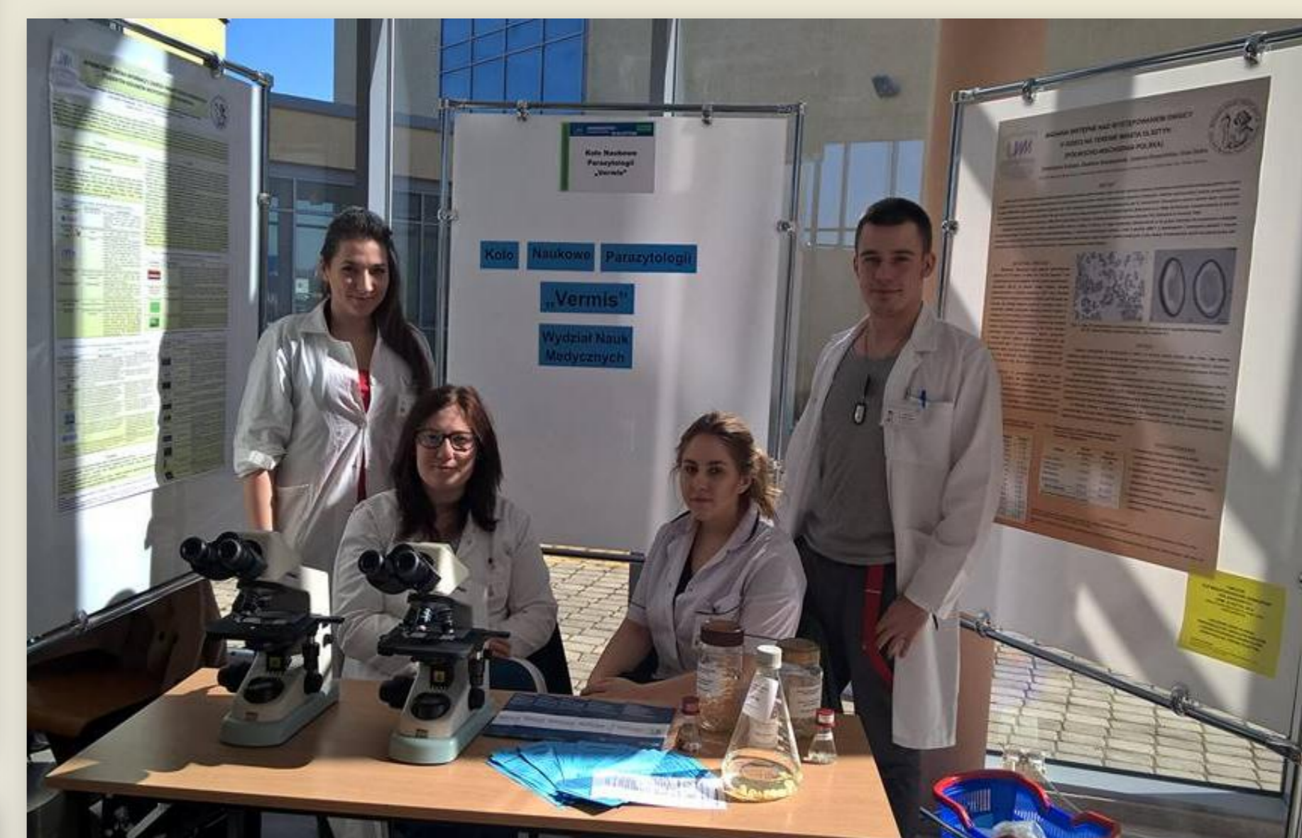
Stoisko Koła podczas Dni Otwartych UWM w Olsztynie, 2015